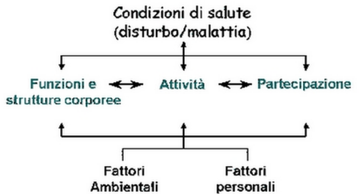
Fig.1 Struttura dell'ICF: componenti e loro interazioni

In base alle interazioni bi-pluridirezionali tra le componenti dell'ICF, le dimensioni della disabilità ovvero le menomazioni, le limitazioni nelle attività e le restrizioni alla partecipazione, sono determinate dall'interazione tra le condizioni di salute della persona e l'ambiente in cui vive, ovvero le circostanze di vita.